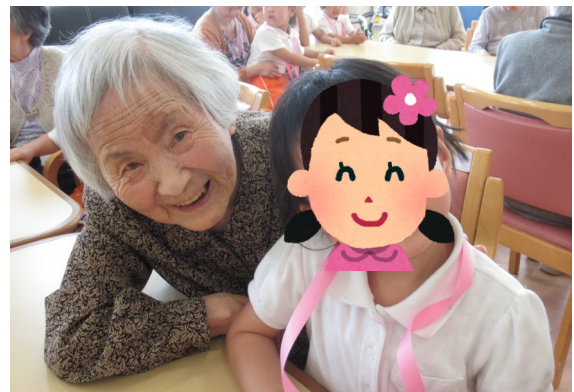
T保育園の子どもさんが 遊びに来てくれました。