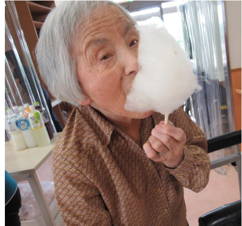
「まあ、綿あめなんて懐かしい～★」