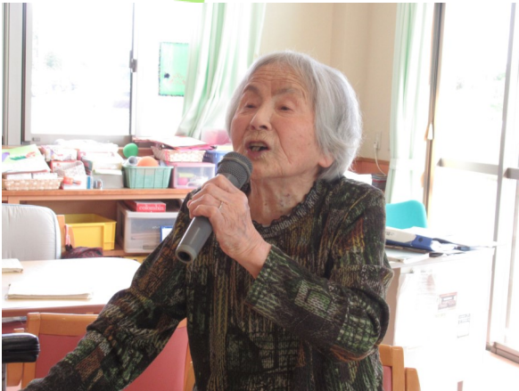
「お嫁に行きます となり村～♪王さん、待ってて ちょうだいね♥Kさんの18番「満州娘」は平成生まれの職員も一緒に歌えるようになりました(^_^)