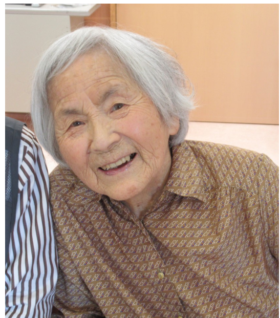
この笑顔の為にこれからも職員一同、 お手伝いさせていただきます！