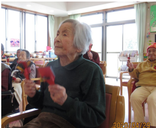
音楽療法の時間は鳴子を持って 参加されます。