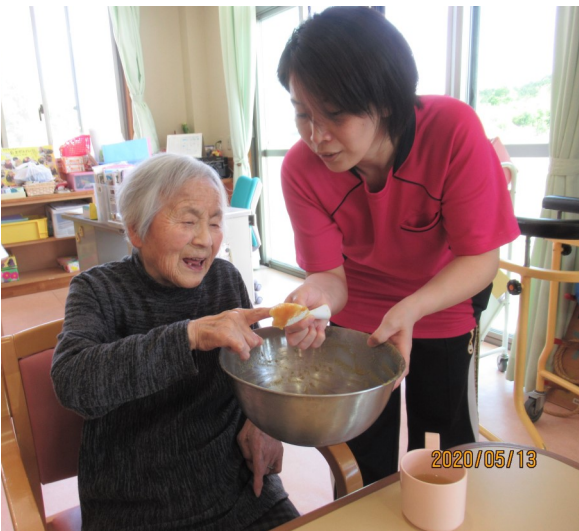
手作りおやつ『五平餅』の味噌のお味を 大先輩にお伺い。 「よいお味です。」の一言に職員一安心。