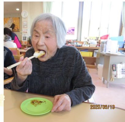
美味しいと太鼓判をいただきました。