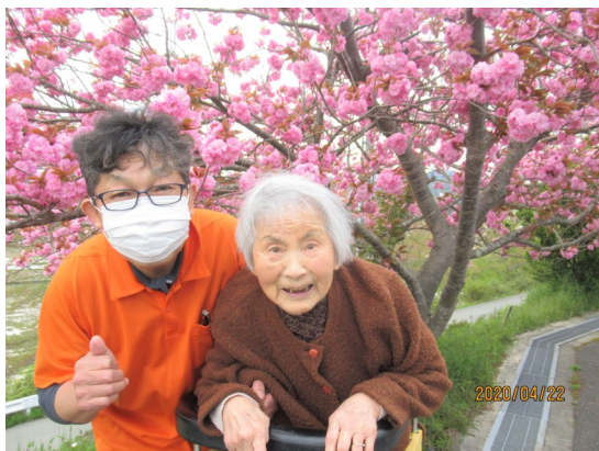
令和2年の園内でのお花見のショット(^_^)v