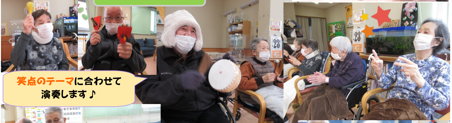
笑点のテーマに合わせて演奏します♪