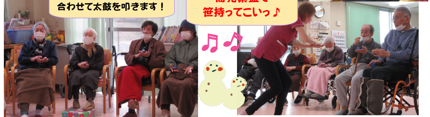
商売繁盛で 笹持ってこいっ♪